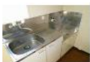
コンパクトキッチン