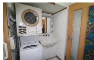
共同 コインランドリ