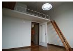
フローリング8帖とうれしいロフト