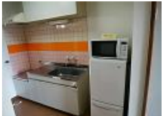
冷蔵庫・電子レンジ完備