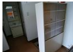
食器棚・洗面化粧台も