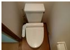
ウォシュレット完備